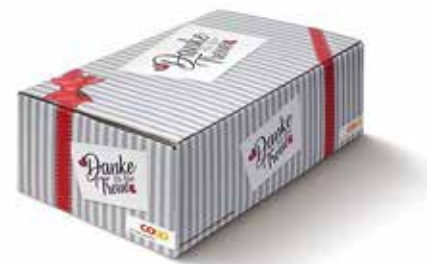
3. Flexo-Preprintdruck – komplexer Druck, für Grossserien