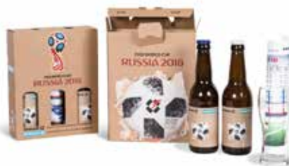
5. Digitaldruck – Flexibilität, Vielseitigkeit, häufiger Wechsel des Drucksujets für kleine und mittelgrosse Serien