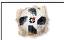
Titelbild Fussball WM 2018 in Wellkarton