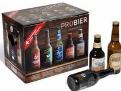
4. Offset-Preprintdruck – komplexer Druck, für mittelgrosse Serien