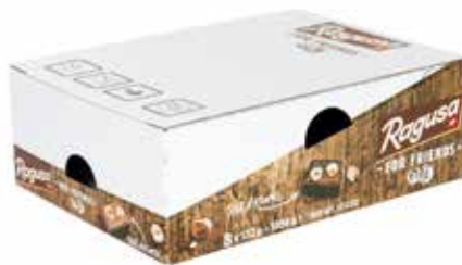
2. Premium-Flexodirektdruck – komplexer Druck