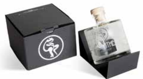
6. Siebdruck – Personalisierung, für Kleinserien