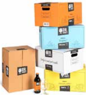
1. Standard-Flexodirektdruck – Druck mit einfachem bis mittlerem technischen Schwierigkeitsgrad