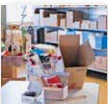
Titelbild Showroom BRIEGER