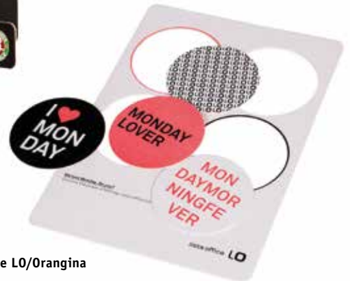
Brooklyn Bier/Lista Office LO/Orangina