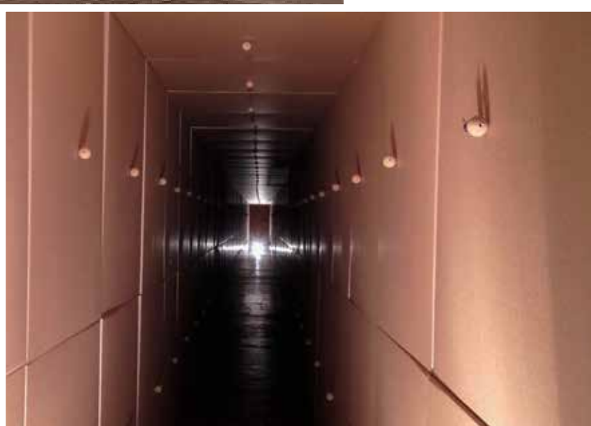
Tunnel im Inneren der Klangskulptur