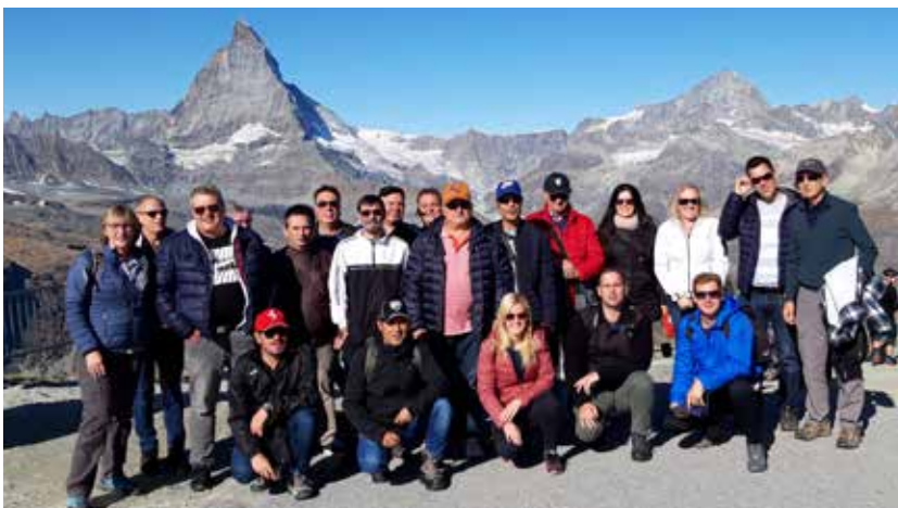
Impressionen der High Fidelity Club Reise 2019 in der nächsten Ausgabe